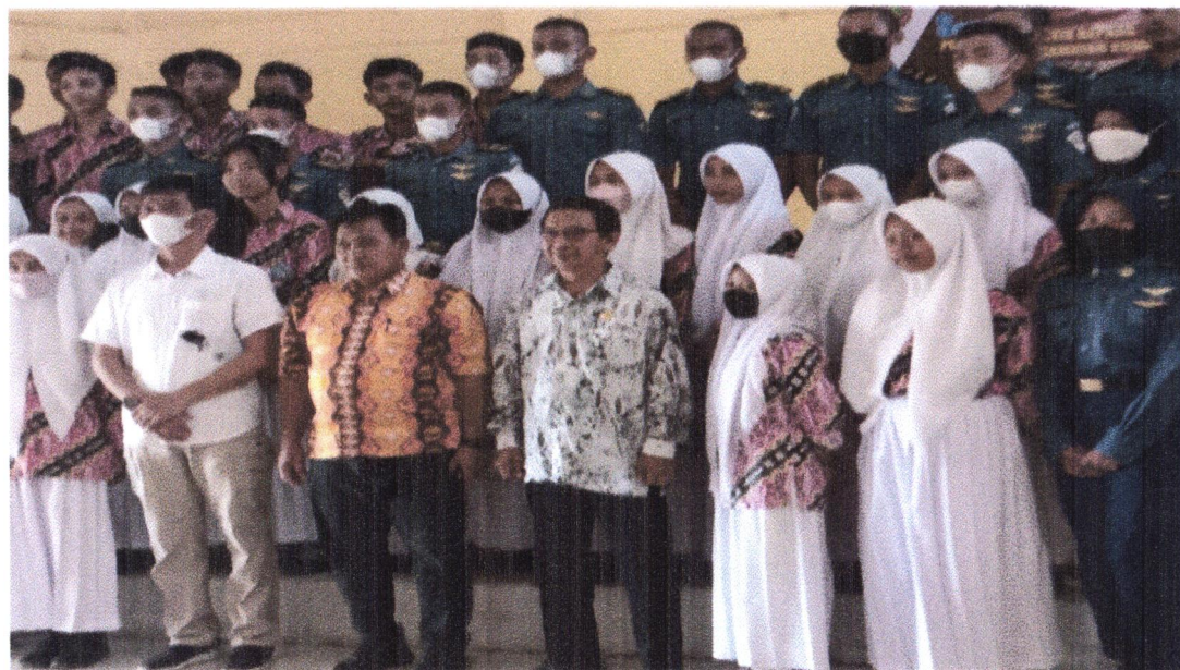
KEGIATAN SOSIALISASI PENDIDIKAN POLITIK DI KEC. KUMAI TANGGAL, 02 JUNI 2022