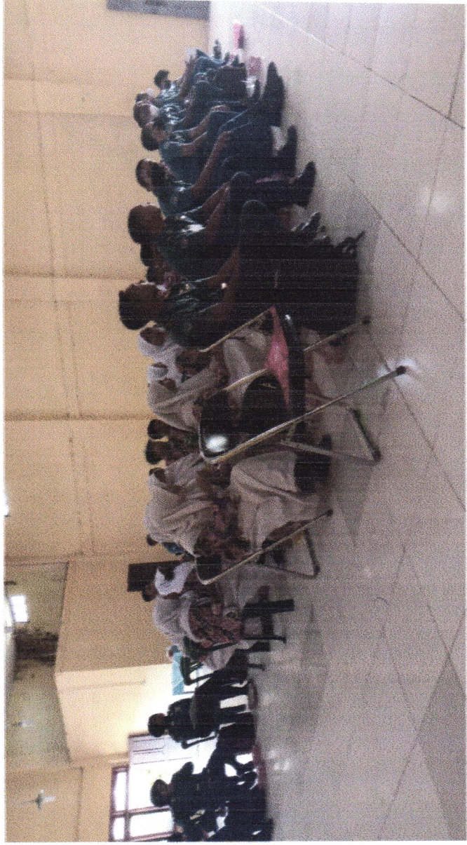
KEGIATAN SOSIALISASI PENDIDIKAN POLITIK DI KEC. KUMAI TANGGAL, 02 JUNI 2022