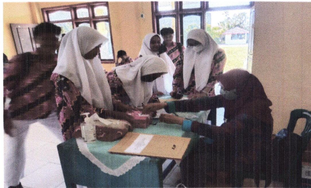
KEGIATAN SOSIALISASI PENDIDIKAN POLITIK DI KEC. KUMAI TANGGAL, 02 JUNI 2022