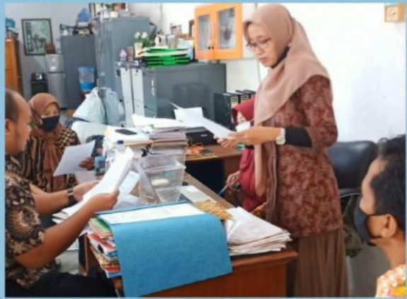
MONEV PENGELOLAAN PPID PEMBANTU DISPERINDAGKOP UKM