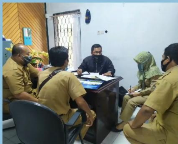
MONEV PENGELOLAAN PPID PEMBANTU DINAS PUPR