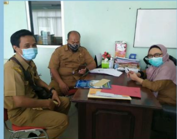
MONEV PENGELOLAAN PPID PEMBANTU RSUD SULTAN IMANUDDIN