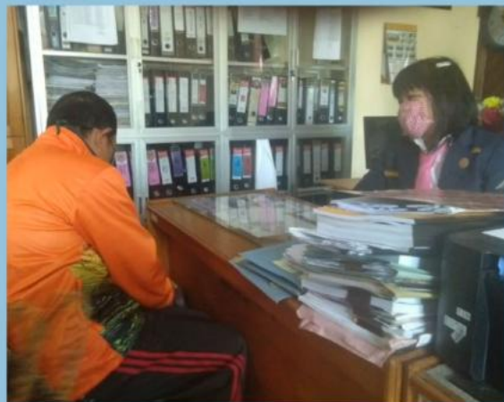
MONEV PENGELOLAAN PPID PEMBANTU SEKRETARIS DPRD