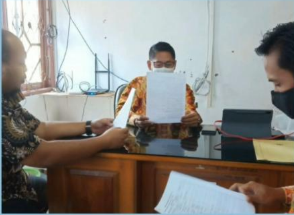
MONEV PENGELOLAAN PPID PEMBANTU SEKRETARIAT DAERAH