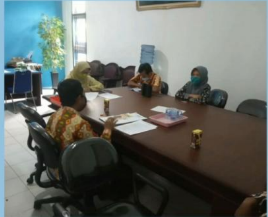
MONEV PENGELOLAAN PPID PEMBANTU DINAS PERIKANAN