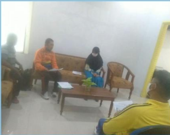
MONEV PENGELOLAAN PPID PEMBANTU BAPPEDA