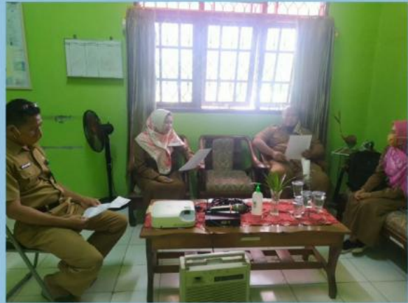
MONEV PENGELOLAAN PPID PEMBANTU DLH