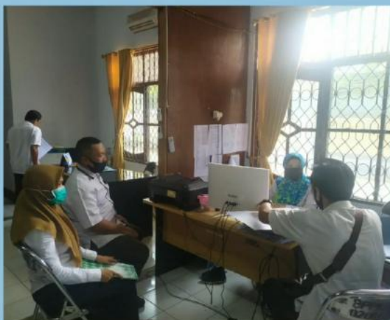
MONEV PENGELOLAAN PPID PEMBANTU DP3AP2KB