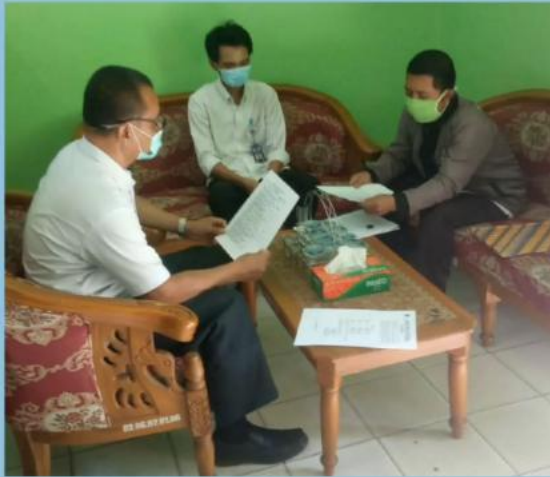
MONEV PENGELOLAAN PPID PEMBANTU PERKIM