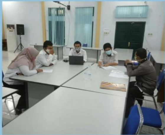
MONEV PENGELOLAAN PPID PEMBANTU DINAS KESEHATAN