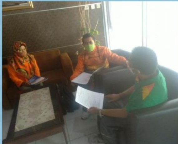
MONEV PENGELOLAAN PPID PEMBANTU BKPP