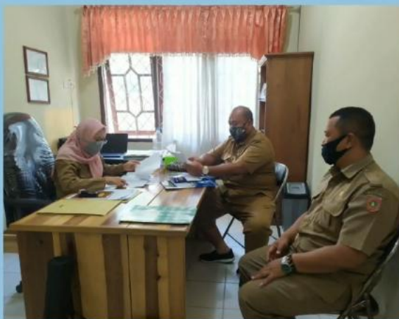
MONEV PENGELOLAAN PPID PEMBANTU BAPENDA