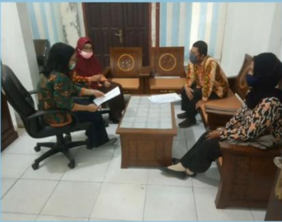
MONEV PENGELOLAAN PPID PEMBANTU DINAS TPHP