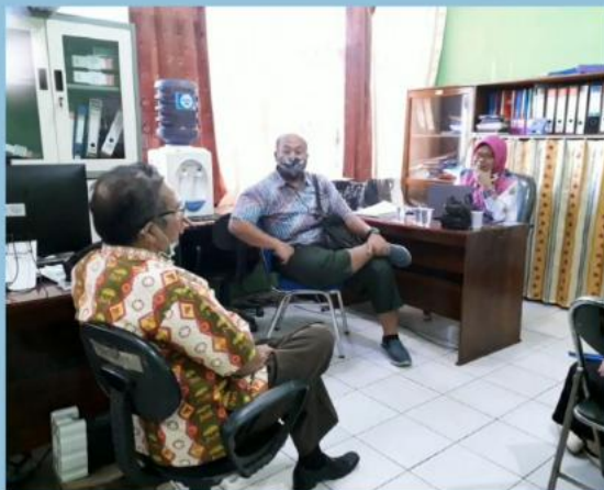
MONEV PENGELOLAAN PPID PEMBANTU DINAS SOSIAL