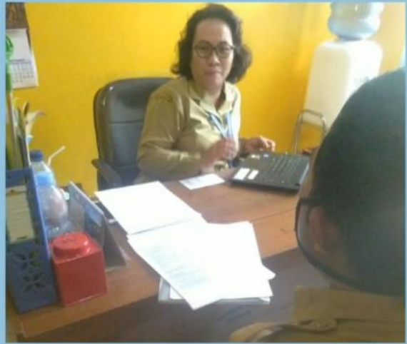
MONEV PENGELOLAAN PPID PEMBANTU DISDUKCAPIL