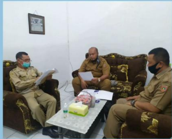
MONEV PENGELOLAAN PPID PEMBANTU DPKH