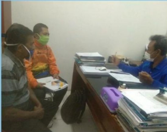
MONEV PENGELOLAAN PPID PEMBANTU PDAM TIRTA ARUT