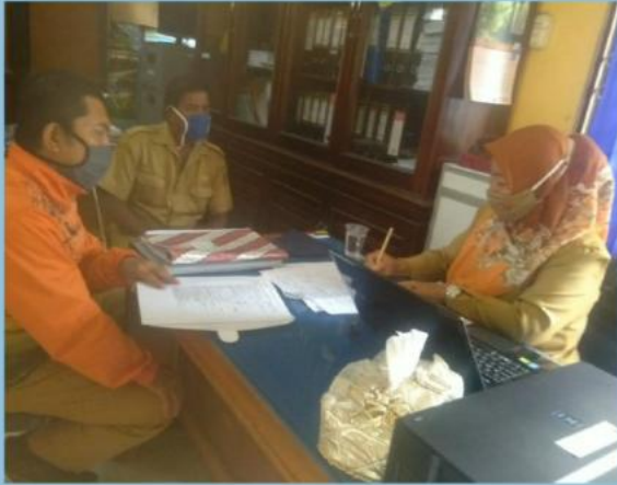
MONEV PENGELOLAAN PPID PEMBANTU DINAS PARIWISATA