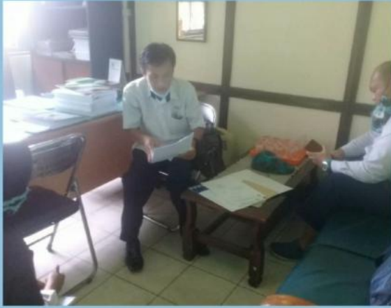
MONEV PENGELOLAAN PPID PEMBANTU DINAS PMD