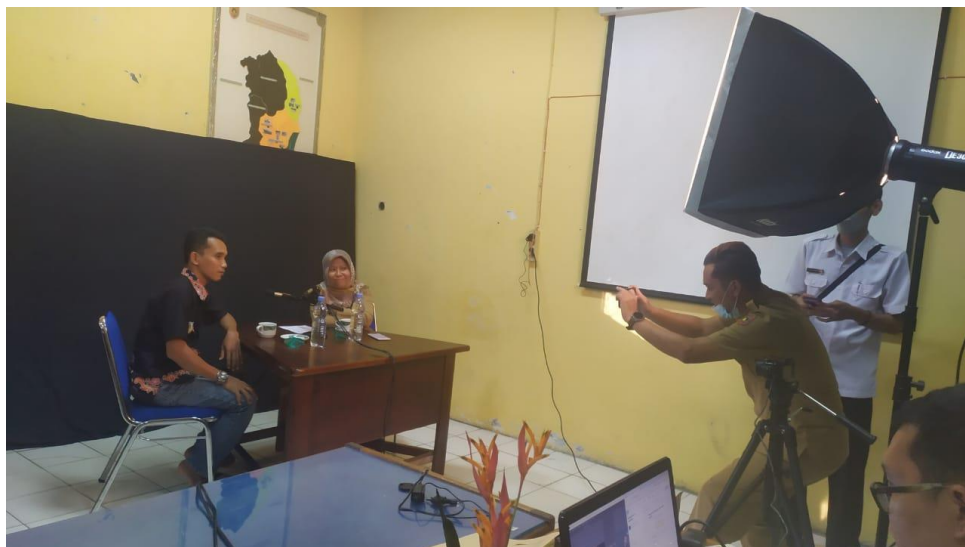
Figure 3 Persiapan Sharing Session Tema Wisata Batik