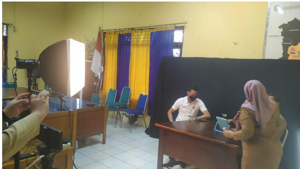
Figure 6 Persiapan Sharing Session Tema Animator Profesi Masa Depan