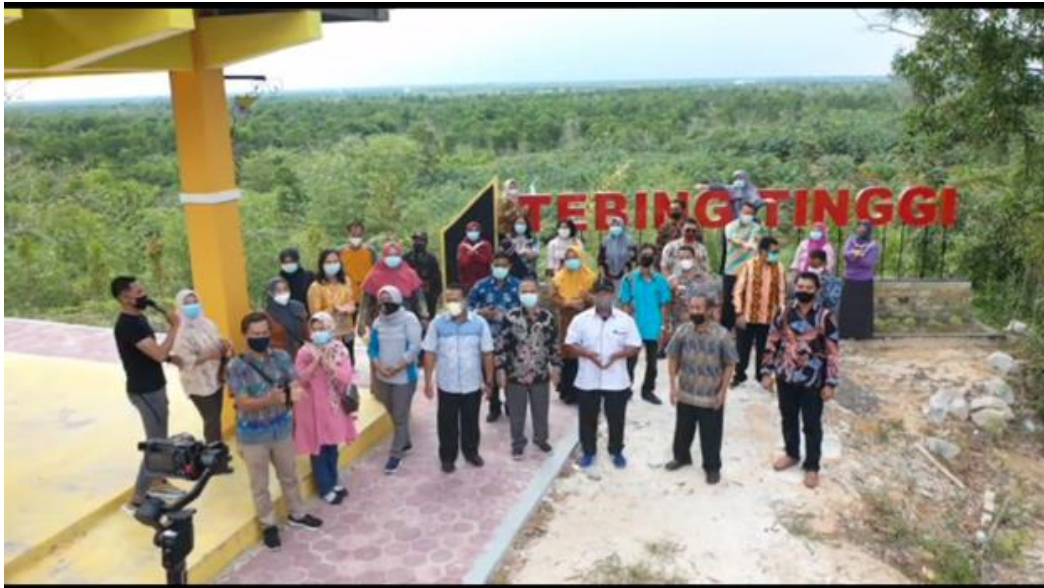
Figure 1 Proses Pengambilan Foto dan Video kegiatan Pisah Sambut Pegawai Lama dan Pegawai Baru di objek daya tarik wisata baru di Desa Kumpai Batu Atas sekaligus mengumpulkan materi promosi terkait potensi wisata Tebing tinggi