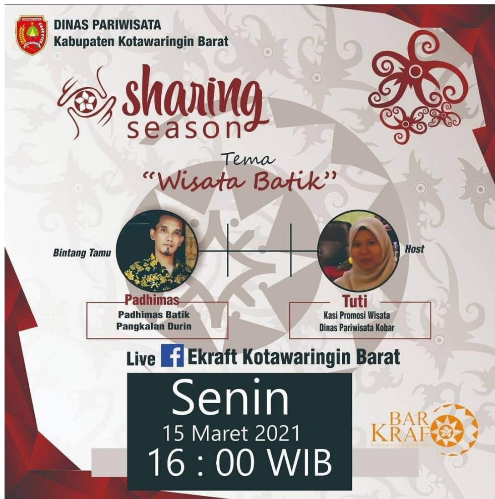
Figure 4 Sharing Session Tema Wisata Batik