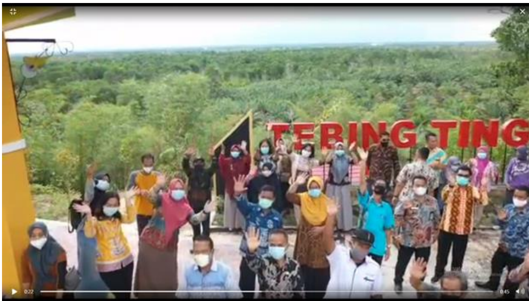
Figure 2 Proses Pengambilan Foto dan Video kegiatan Pisah Sambut Pegawai Lama dan Pegawai Baru di objek daya tarik wisata baru di Desa Kumpai Batu Atas sekaligus mengumpulkan materi promosi terkait potensi wisata Tebing tinggi