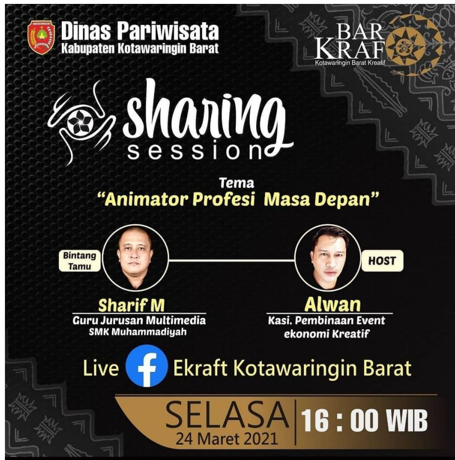
Figure 5 Sharing Session Tema Animator Profesi Masa Depan