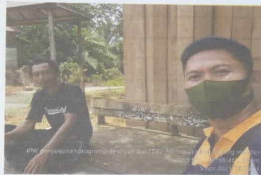
Ketua Poktan Jamban Garung Mandiri