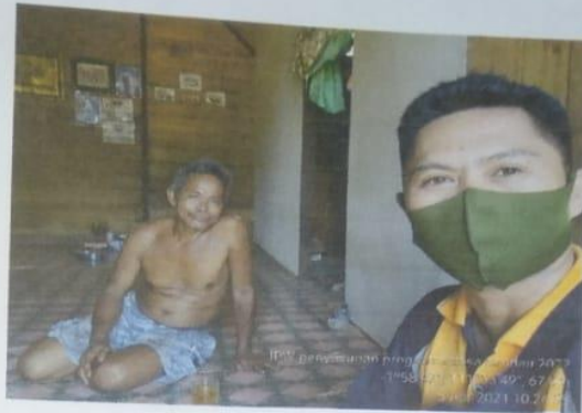
Ketua Gapoktan Tunas Harapan